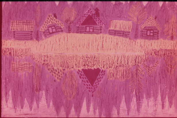
Бабушка жила в деревне на другом берегу реки.