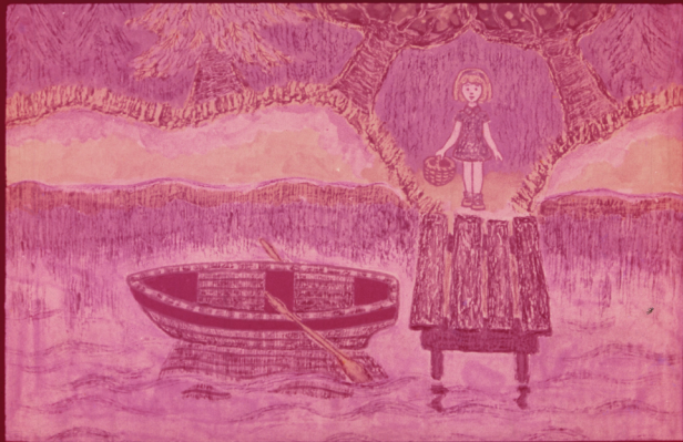
Вот пришла Маша к реке. Река широкая и глубокая. Видит Маша: оноло берега начается на волнах лодочна.