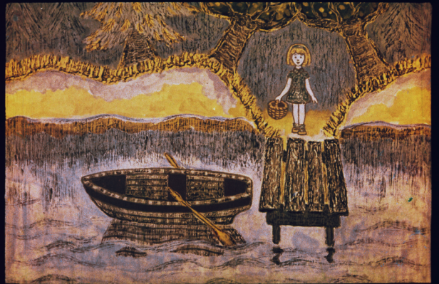
Вот пришла Маша к реке. Река широкая и глубокая. Видит Маша: оноло берега начается на волнах лодочна.