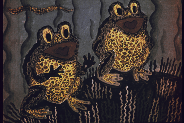
— Ладно, — проквкали лягушки.