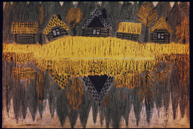
Бабушка жила в деревне на другом берегу реки.